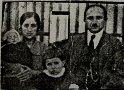
[Signed photograph of declarant.] [Photographie signée du déclarant.]